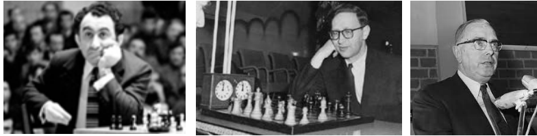
Tigran Petrosian, Vasily Smyslov, Max Euwe

Handwritten signatures of Tigran Petrosian, Vasily Smyslov, and Max Euwe.