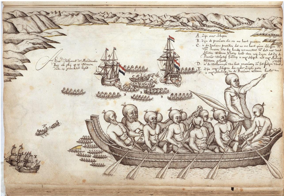
De ontdekking van Nieuw-Zeeland (Maori: Aotearoa) door Abel Tasman in 1642.

Hoe goed zijn die schakers uit Nieuw-Zeeland eigenlijk? Ik keek naar de uitslagen van de schaakolympiades sinds het jaar 2000: 87, 87, 84, 91, 97, 91, 97, 98, 95, 87. Stabiel maar niet geweldig. Een plekje ergens op de helft. Versterking is welkom. Emigreren naar Nieuw-Zeeland lijkt mij voor een grootmeester of meester die ook weleens aan een schaakolympiade mee wil doen en het in eigen land, Nederland bijvoorbeeld, niet lukt een idee dat de moeite van het overwegen waard is. Wie durft de reis naar het land van de krijgsvreemde Maori's aan?