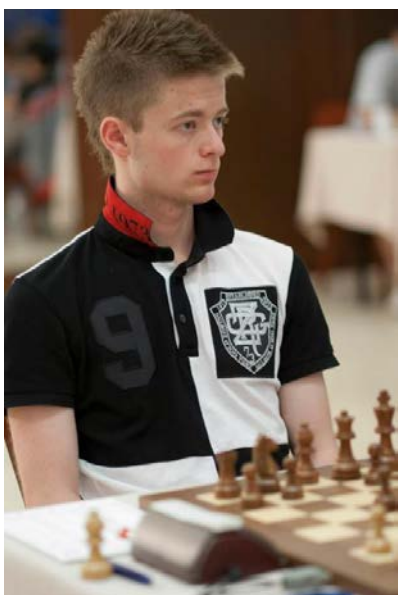
IM Aman Hambleton (2013)

De hoogblonde Canadese schaker Aman Hambleton (geb. 1992) viel nogal op tijdens het 'VIII Campeonato Continental de las Américas' dat in mei 2013 in Cochabamba, Bolivia, verspeeld werd. Vrijwel alle overige deelnemers aan het toernooi waren namelijk donker getinte latino's uit Peru, Bolivia, Cuba, Paraguay, etc..