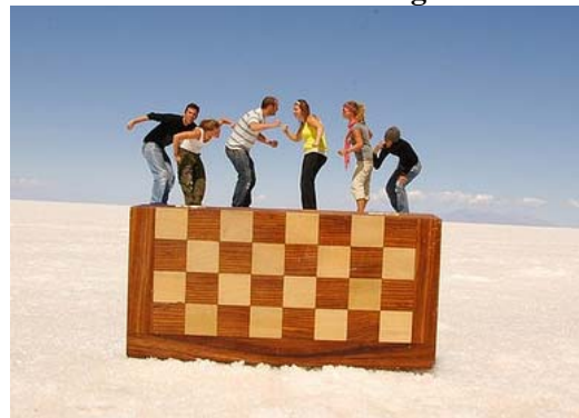
Salar de Uyuni, Bolivia.