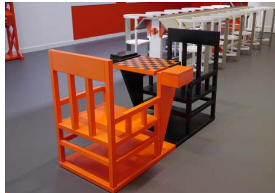
Aleksandr Rodchenko (1925)