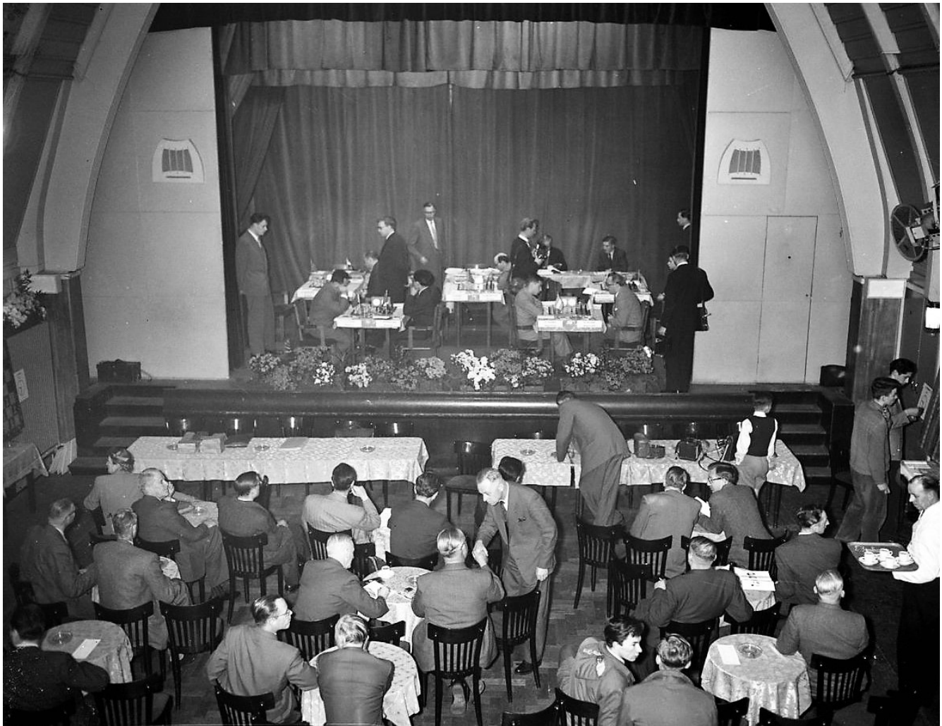
De speelzaal in het Minerva Paviljoen. Goed is te zien hoe weinig bewegingsruimte de spelers op het podium hadden.