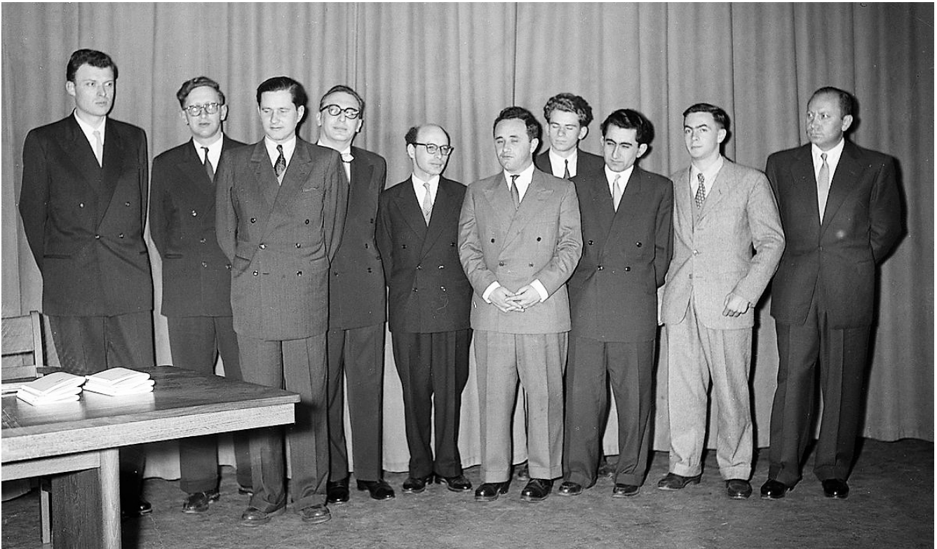
De deelnemers aan het kandidatentoernooi 1956. Van links naar rechts Filip, Smyslov, Keres, Pilnik, Bronstein, Geller, Spasski, Petrosjan, Panno en Szabo.

De ronden 10 en 11 werden in Leeuwarden gespeeld, waar het zeer fraaie Beursgebouw (nu: de centrale bibliotheek) als speelzaal werd ingericht. Die bleek uitermate geschikt. Waar de spelers in Amsterdam op een klein podium met weinig beenruimte speelden, was er in het Beursgebouw ruimte in overvloed. Schaken was destijds hot in Friesland: tijdens de tiende ronde waren er 1.000 toeschouwers en tijdens de elfde zelfs 1.200!